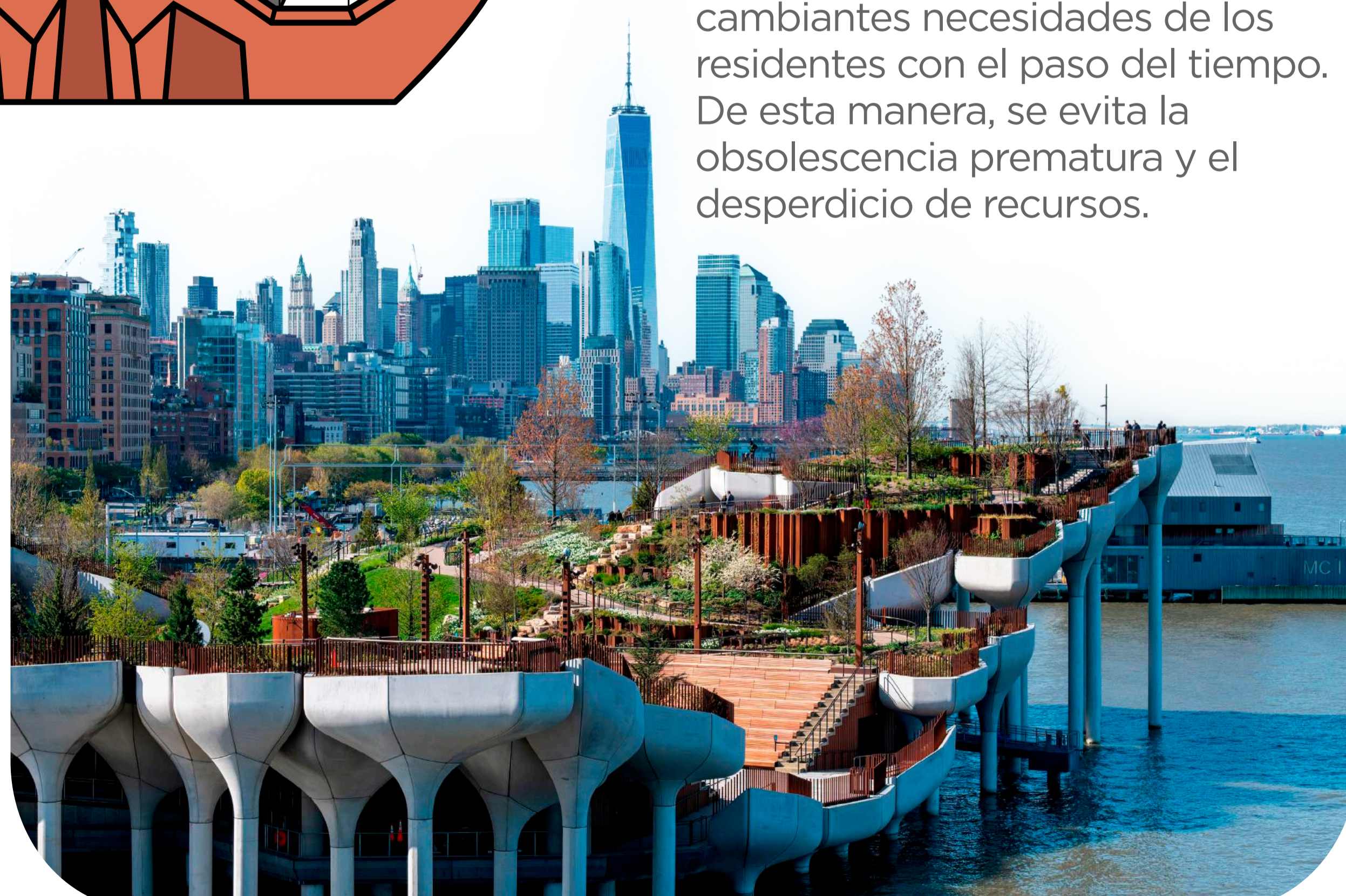
Parque público de Little Island ubicado en el Parque del Río Hudson

Adaptabilidad y flexibilidad: Heatherwick apuesta por proyectos basados en los principios de adaptabilidad y flexibilidad, lo que les permite ajustarse a las cambiantes necesidades de los residentes con el paso del tiempo. De esta manera, se evita la obsolescencia prematura y el desperdicio de recursos.